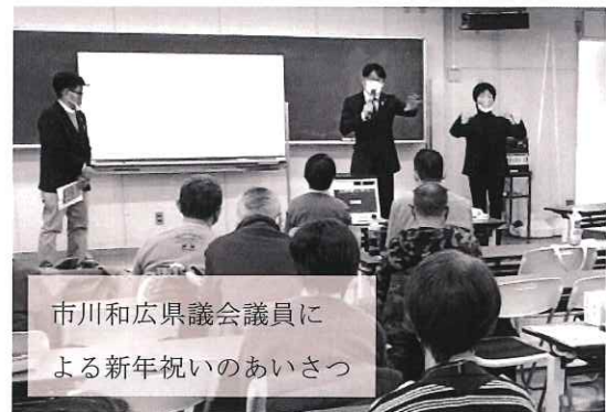
市川和広県議会議員に よる新年祝いのあいさつ