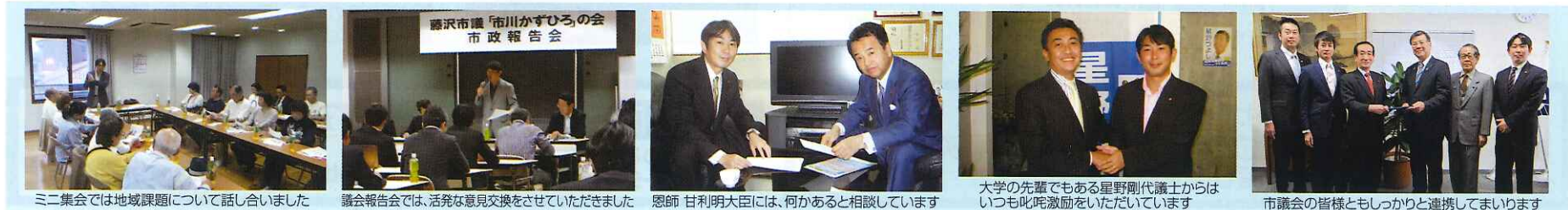
ミニ集会以は地域課題について話し合いました