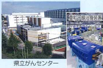
県立がんセンター